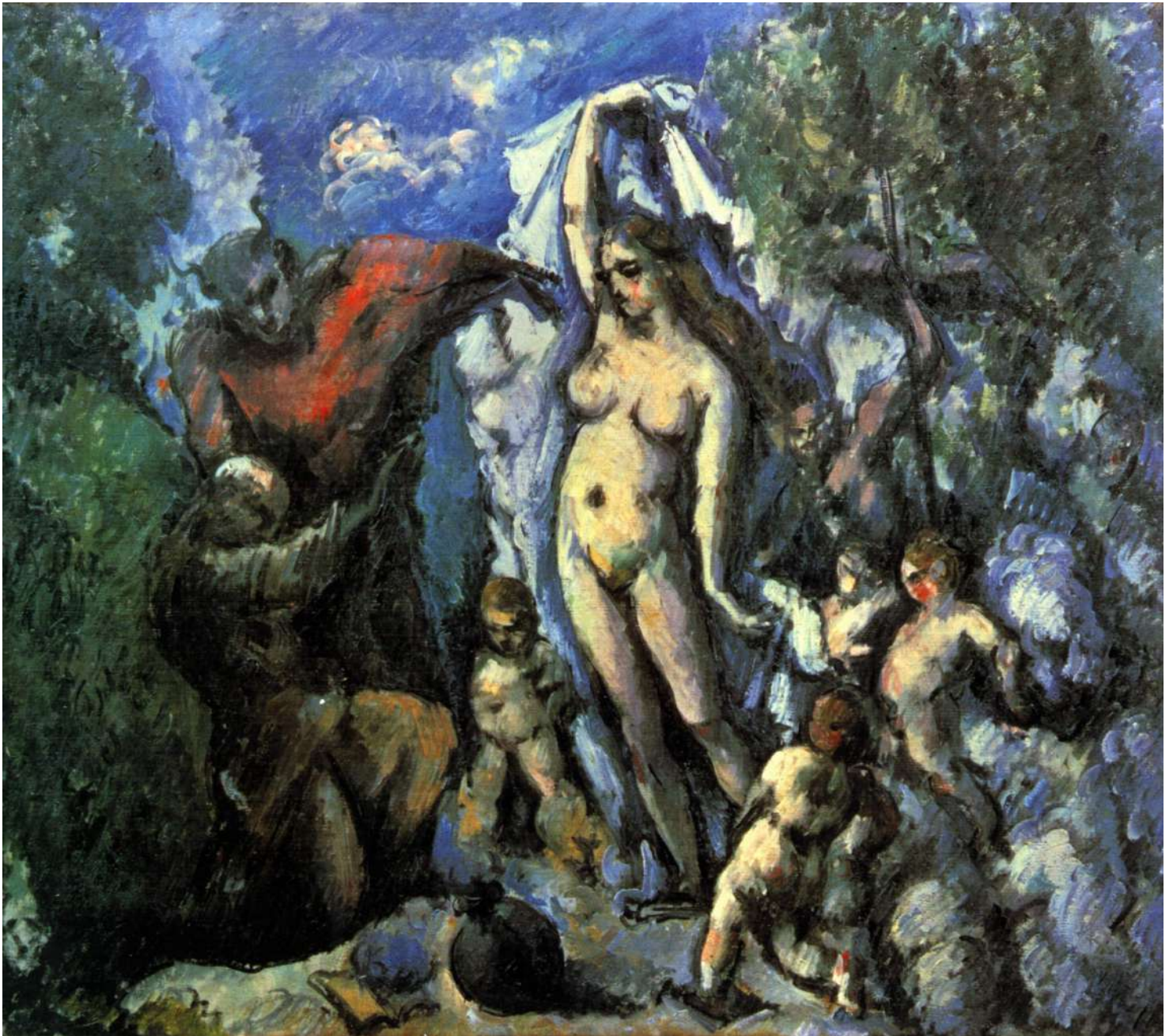
La Tentation de Saint Antoine PAUL CEZANNE · c. 1887

Huile/toile, 47 x 56 cm. Paris : Musée d'Orsay