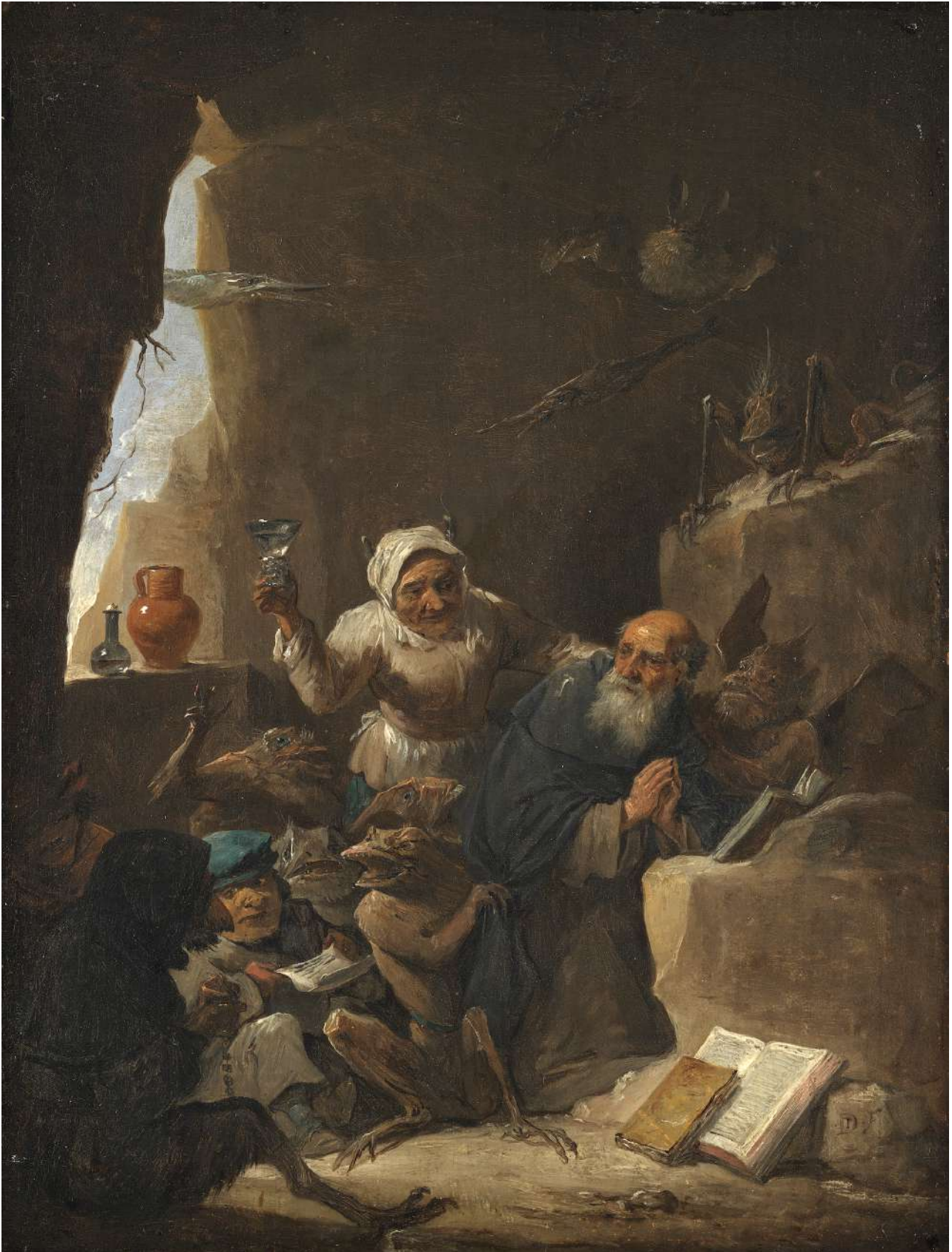
La Tentation de l'abbé Antoine DAVID TENIER LE JEUNE · c. 1640-1650

Huile/panneau, 22 x 17 cm. Londres : The Royal Collection of Paintings and Sculptures