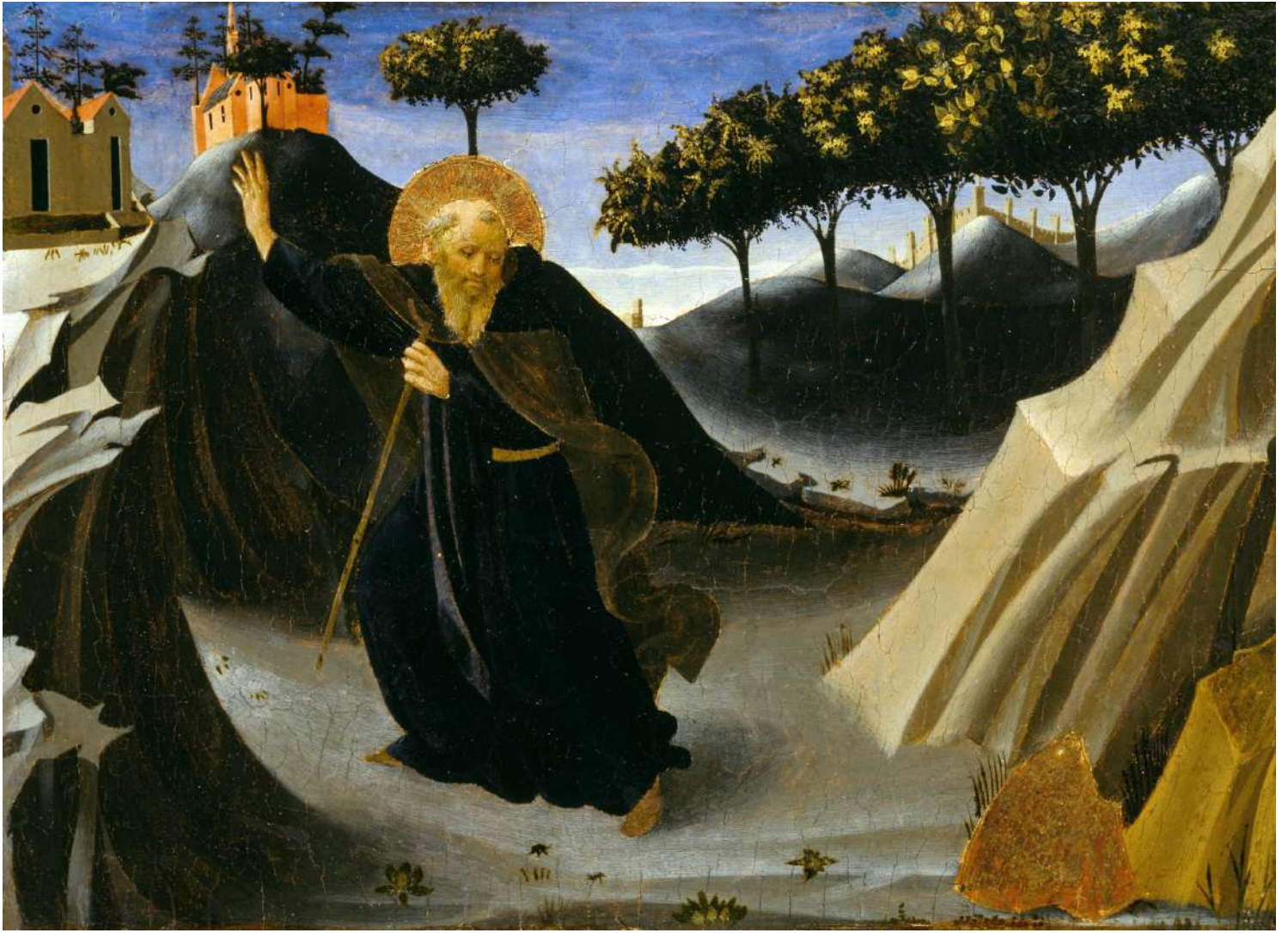
Saint Antoine fuyant des idoles d'or FRA ANGELICO · c. 1435-1440

Détrempe, or/panneau, 19,7 x 28,1 cm. Houston, Texas : Museum of Fine Arts