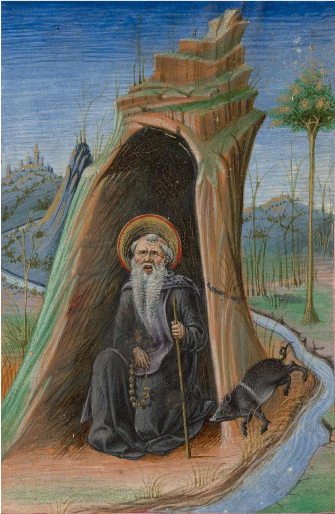
L'abbé Antoine dans la grotte TADDEO CRIVELLI · c. 1469

Détrempe, or et encre/parchemin, 10,8 x 7,9 cm. Los Angeles : The Getty Museum