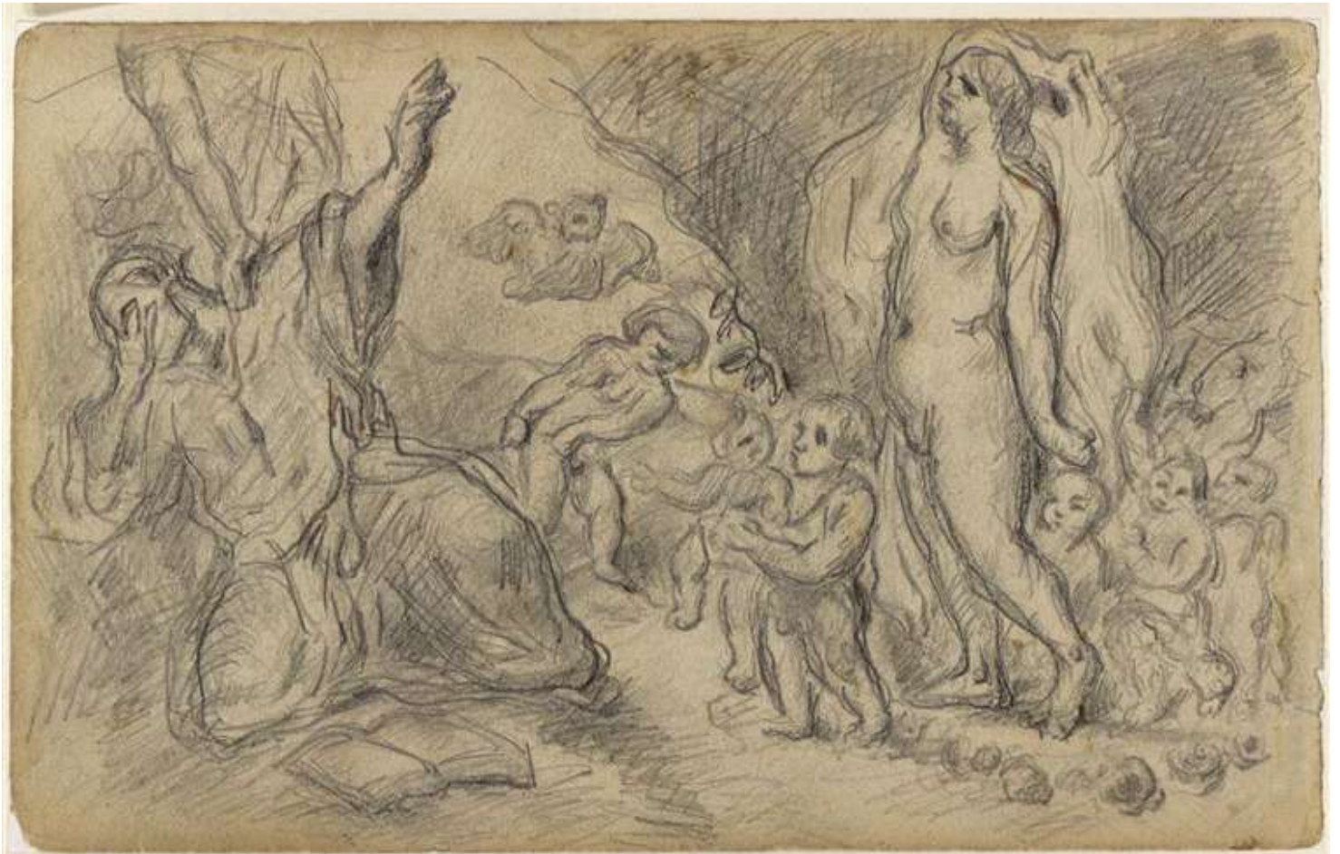
La Tentation de Saint Antoine PAUL CEZANNE · Fin XIX e siècle

Mine de plomb/papier, 13 x 21 cm. Berlin, Kupferstichkabinett (SMPK)