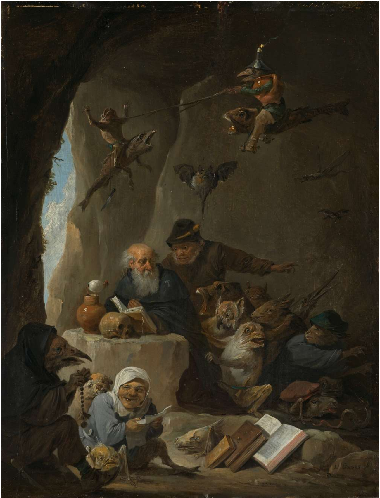
La Tentation de l'abbé Antoine DAVID TENIER LE JEUNE · c. 1640-1660

Huile/panneau, 31 x 23 cm. Amsterdam : Rijksmuseum