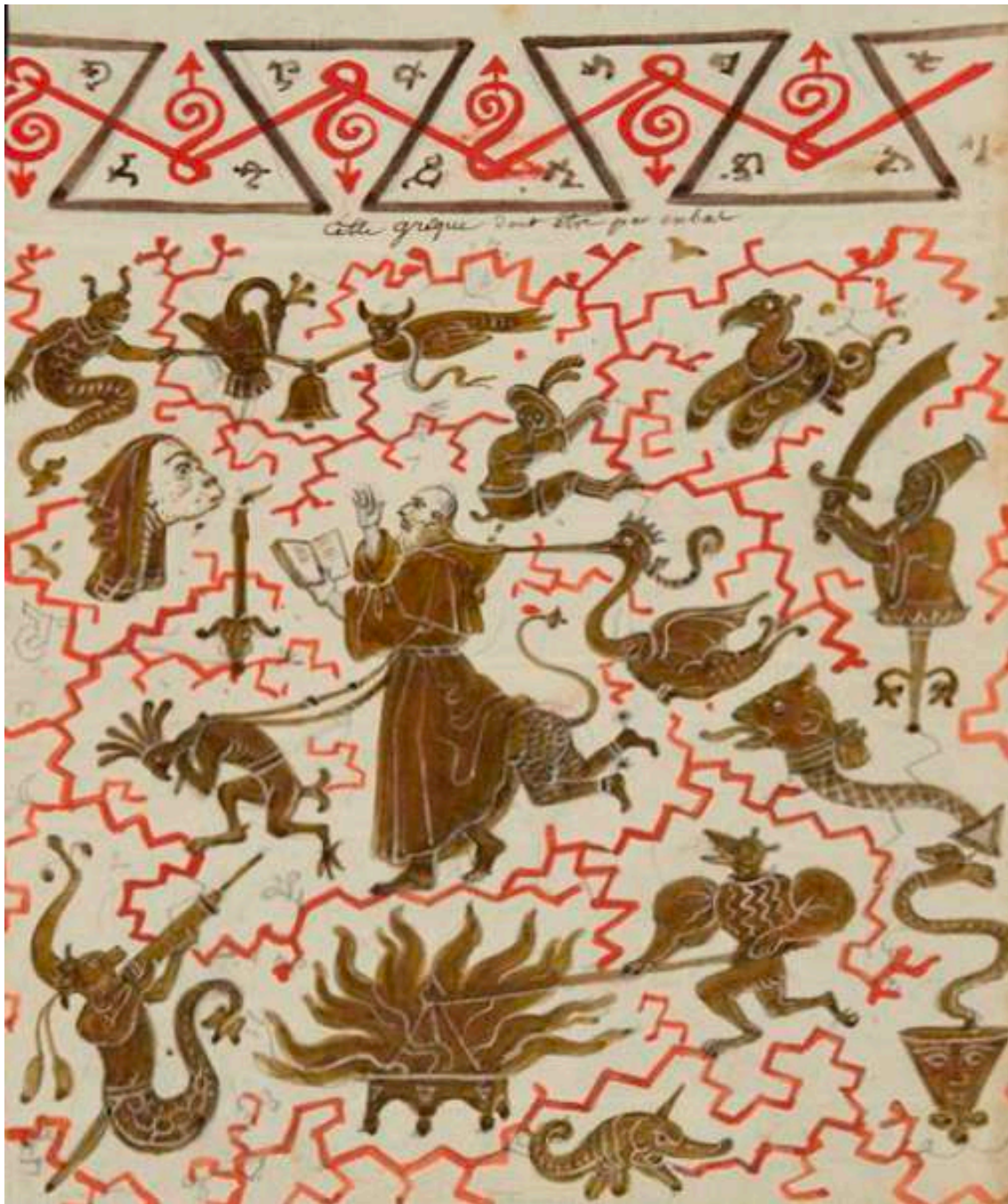
Saint Antoine entouré par les démons JEAN-CHARLES DEVELLY · XIX e siècle

Gouache et graphite/papier, 21 x 15,7 cm. Sèvres : Cité de la céramique