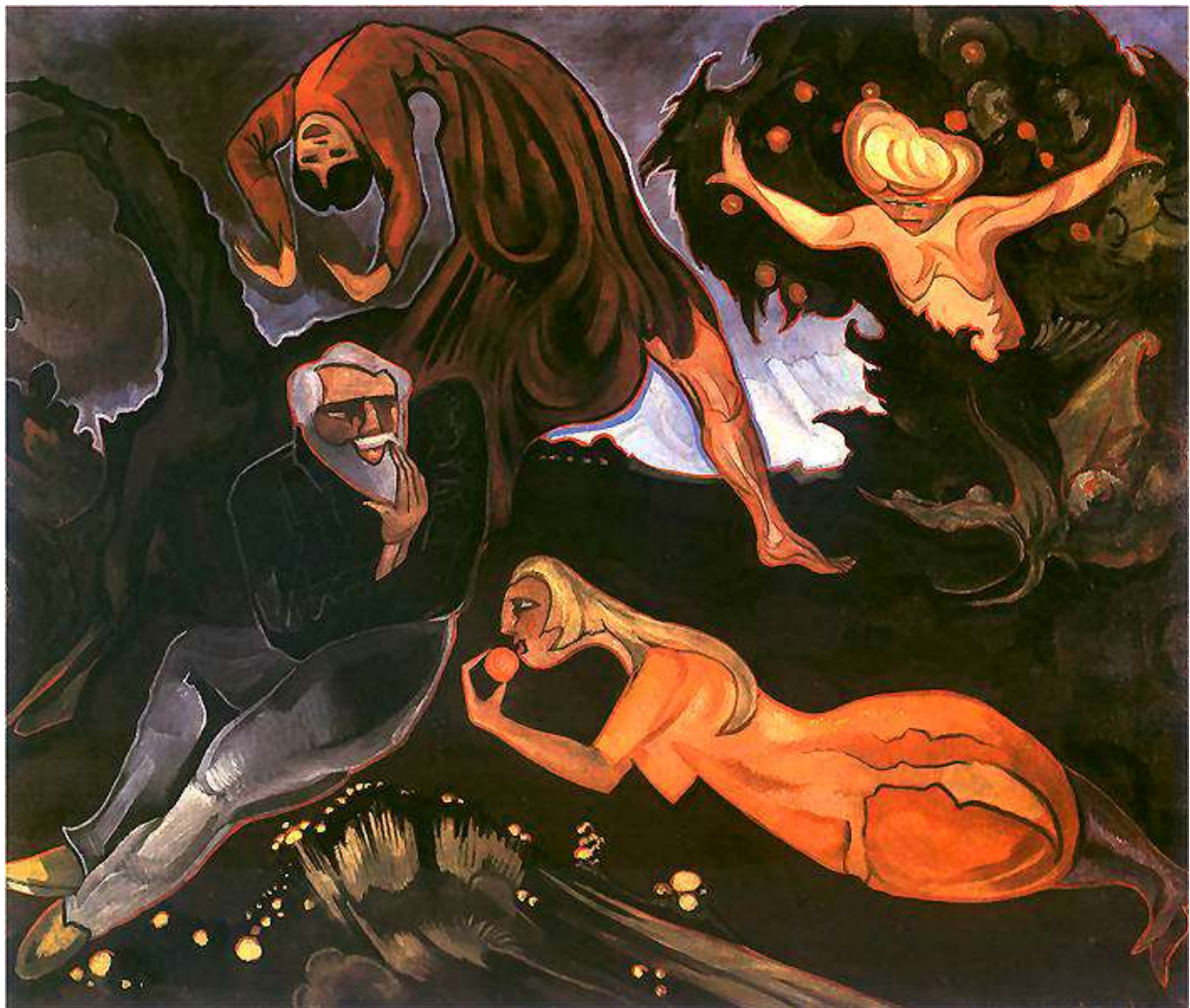
Ensevelissement de St. Antoine STANISŁAW IGNACY WITKIEWICZ · 1916-1921

Huile/toile, 74,5 × 90 cm Cracovie : Muzeum Narodowe w Krakowie