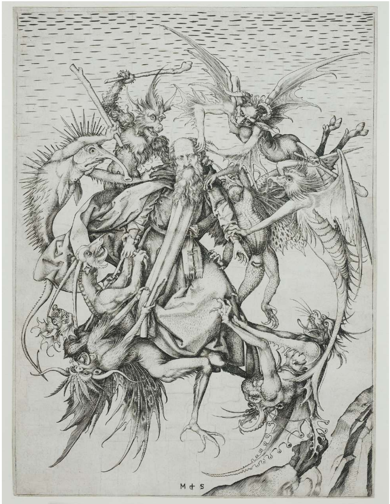
La Tentation de Saint Antoine MARTIN SCHONGAUER · 1474

Burin/papier, 31,7 x 23,4 cm. Colmar : Musée d'Unterlinden