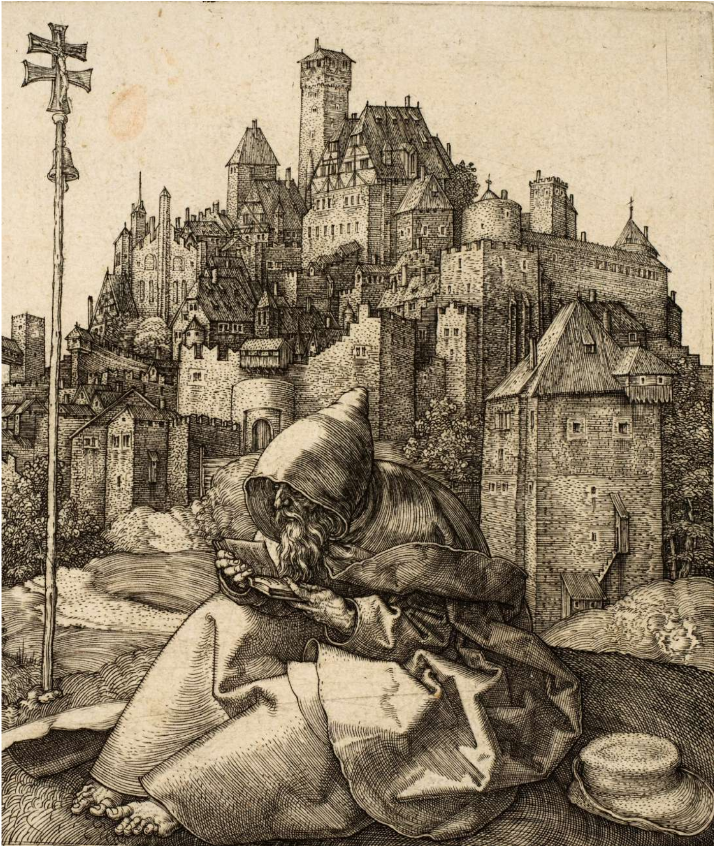
La lecture de St. Antoine ALBRECHT DÜRER · 1519

Eau-forte/papier, 9,8 x 14,3 cm. (fragment) New York : Metropolitan Museum of Art