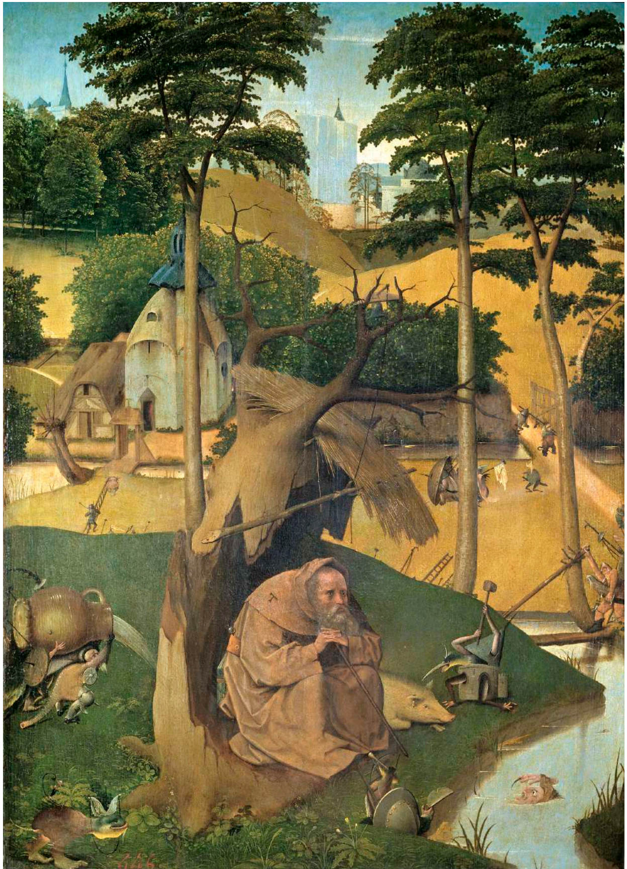
La Tentation de Saint Antoine EL BOSCO [= JHERONIMUS BOSCH] · c. 1520-1525

Huile/panneau, 73 x 52,5 cm. Madrid : Museo del Prado