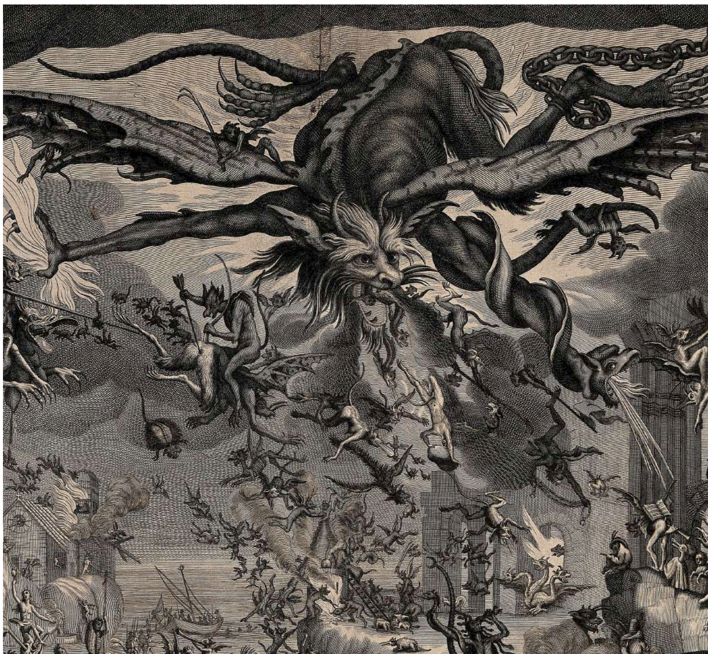
Les tourments de St. Antoine PIERRE PICAULT D'APRES JACQUES CAILLOT · XVIII e siècle

Eau-forte/papier. Londres : Wellcome Collection