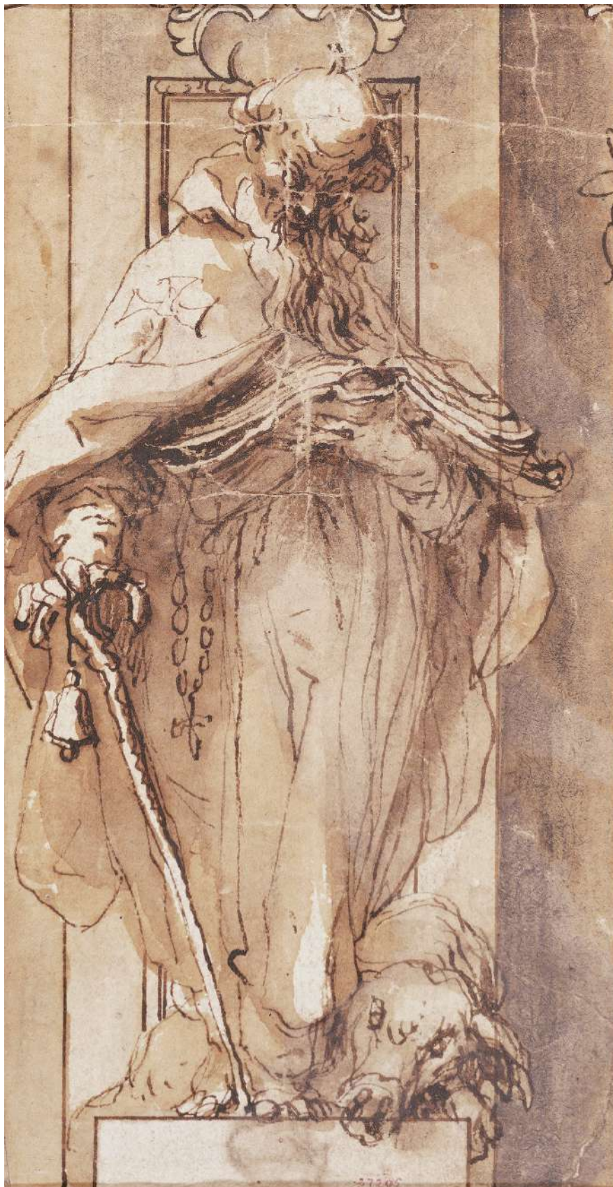
Antoine l'Ermite ALONSO CANO (attribué) · c. 1646

Plume et encre/papier, 16 x 8,4 cm. Barcelone : MNAC