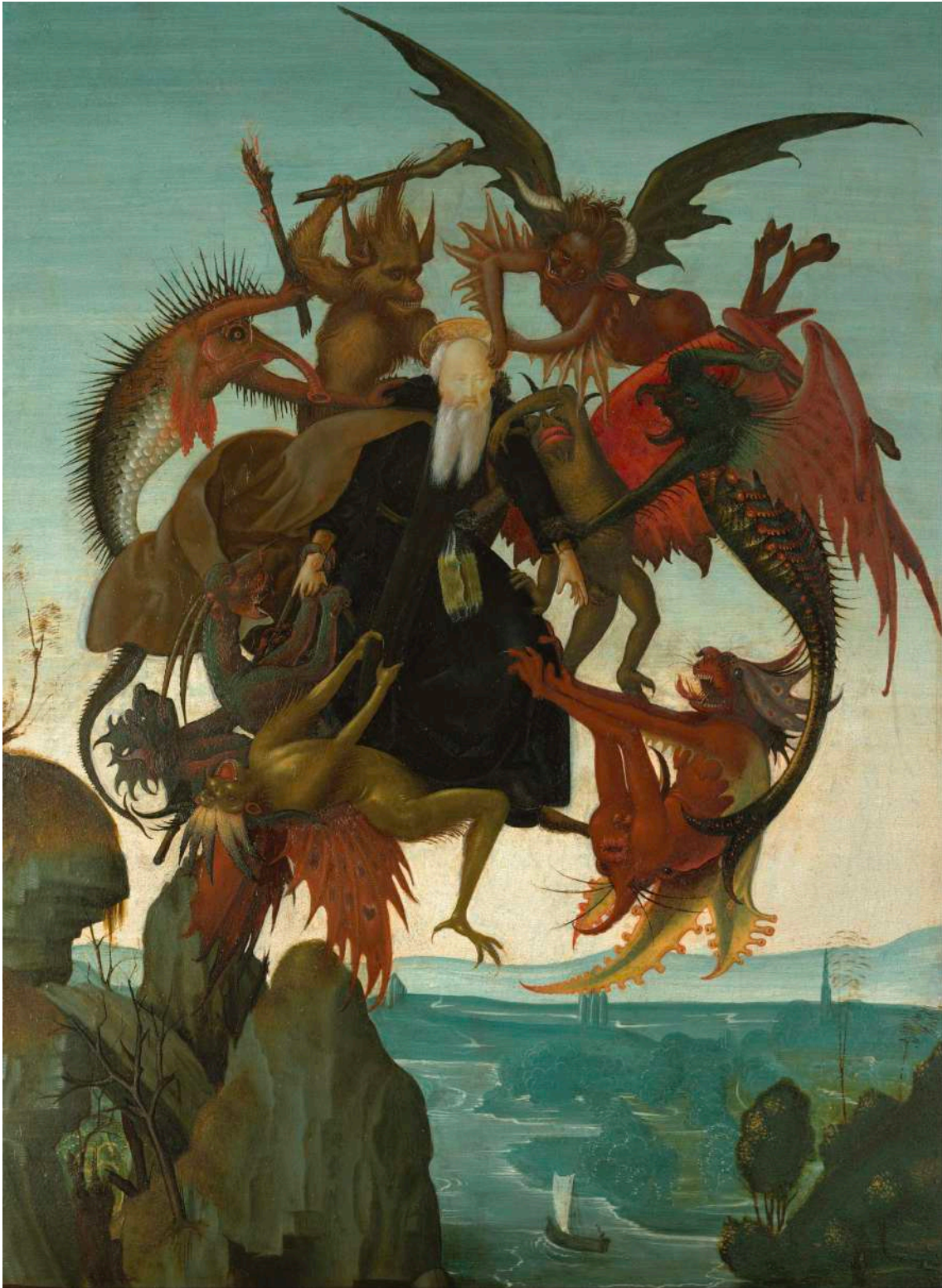
Le Tourment de Saint Antoine MICHELANGELO BUONARROTI · 1487

Détrempe/bois, 47 x 34,9 cm. Fort Worth, Texas : Kibell Art Museum