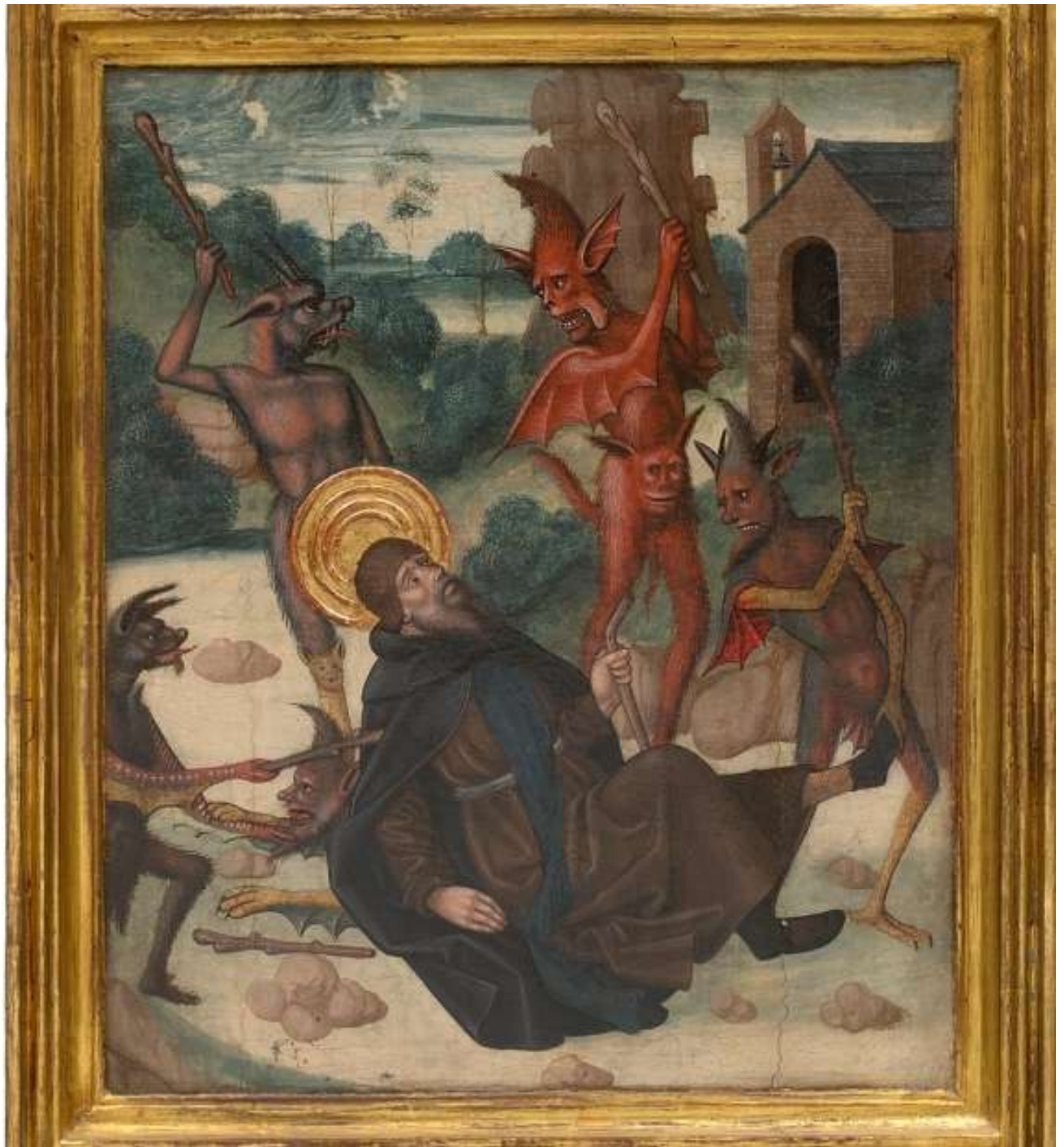
Les démons attaquent Saint Antoine II (« Escenas de la vida de San Antonio Abad »)