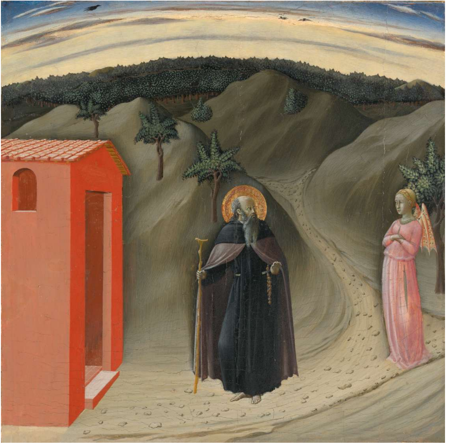
La Tentation de Saint Antoine MAESTRO DEL TRITTICO DELL'OSSERVANZA · c. 1435

Détrempe, or/bois, 38,4 × 40,4 cm. New Haven : Yale University Art Gallery