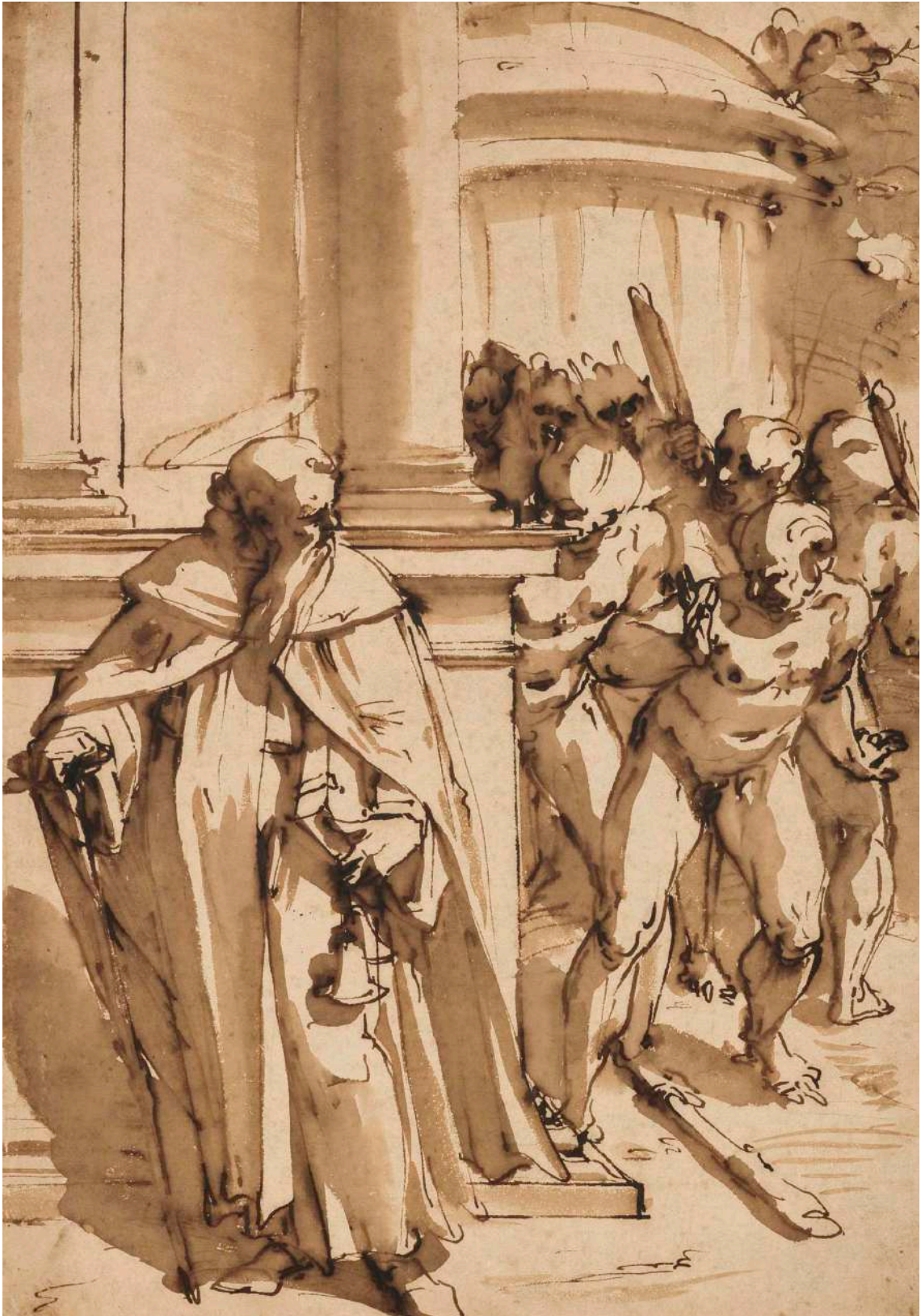
St. Antoine persécuté par les démons LUCA CAMBIASSO · XVI e siècle

Encre et lavis/papier, 41 x 28,6 cm. Collection privée