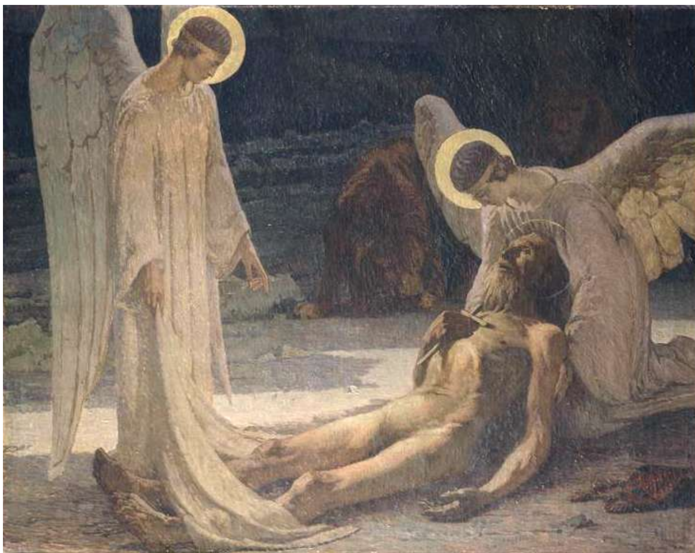
Ensevelissement de St. Antoine CONSTANTIN FONT · 1921