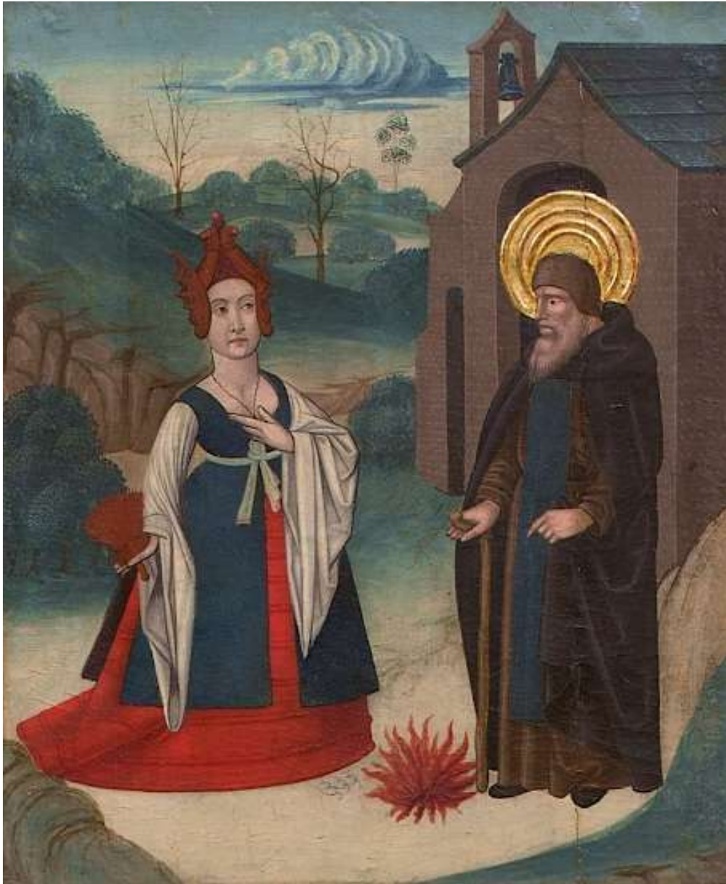
Luxure tentant Saint Antoine I (« Escenas de la vida de San Antonio Abad ») JUAN DE LA ABADIA EL VIEJO · c. 1490

Huile/bois, 190 x 57 cm. Madrid : Museo del Prado