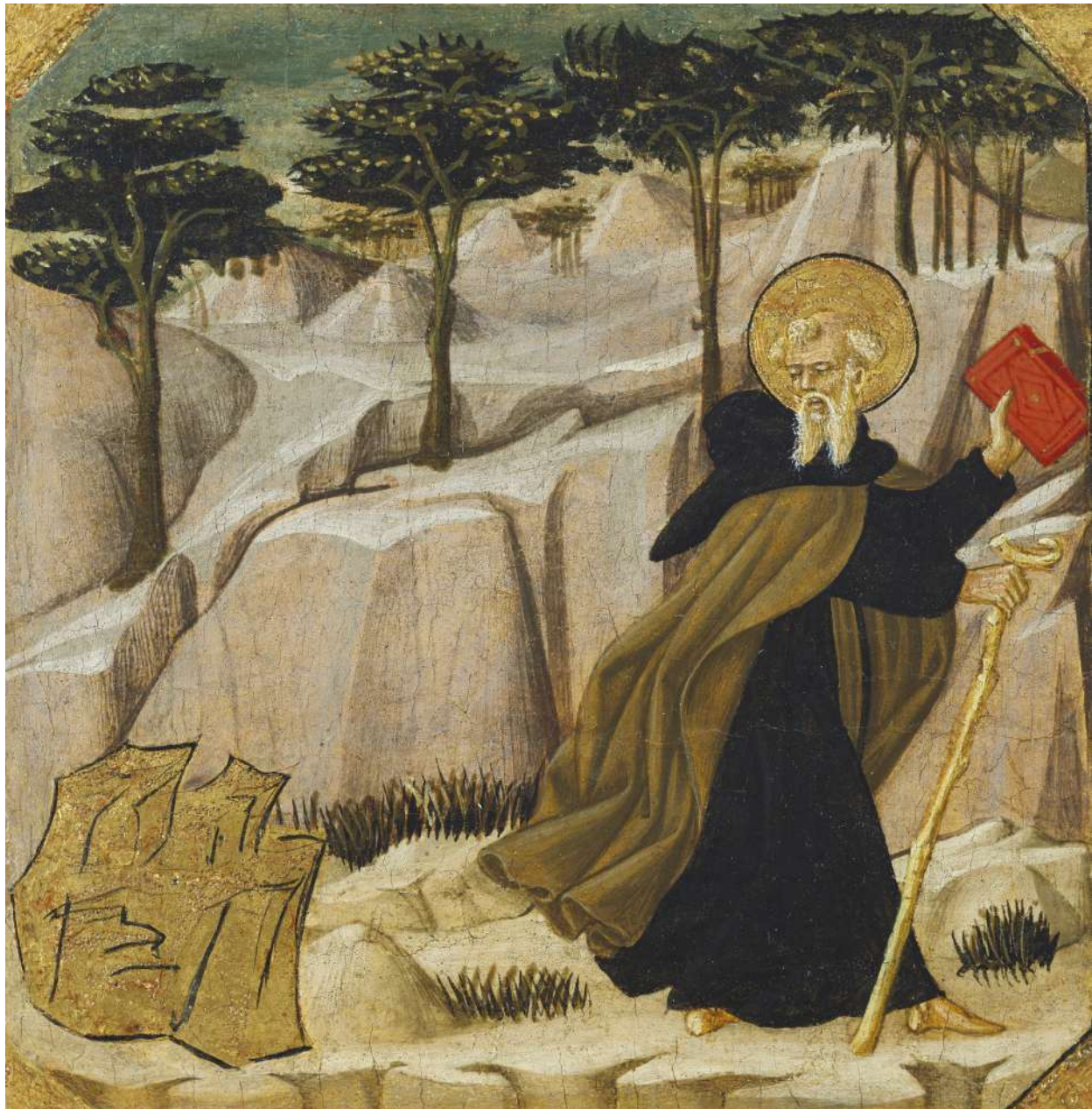
Saint Antoine tenté par l'or LO SCHEGGIA · XV e siècle

Détrempte/panneau, s./m. Birmingham : Birmingham Museum of Art