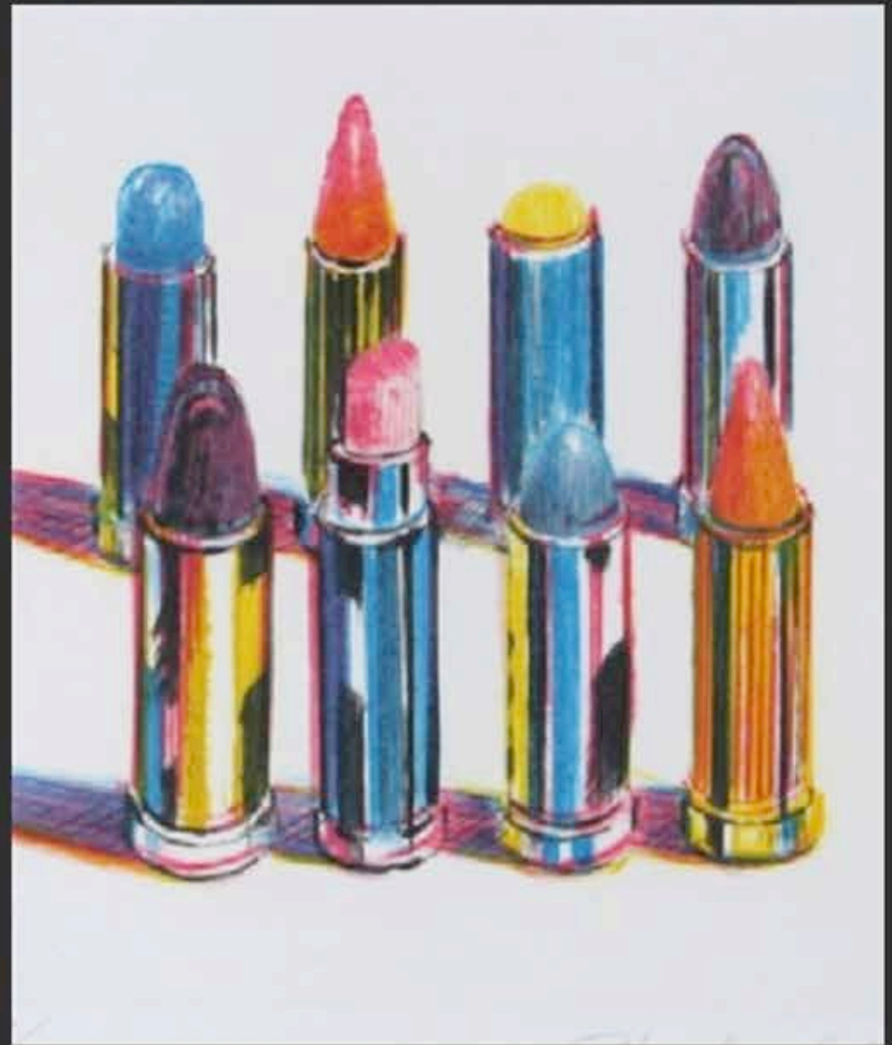
« Rouge à lèvres » WAYNE THIEBAUD (2016)