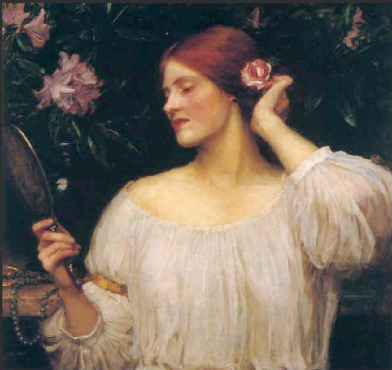
« Vanity » JOHN W. WATERHOUSE (1849-1917)

Huile/toile, 66 x 68.6 cm. Collection privée