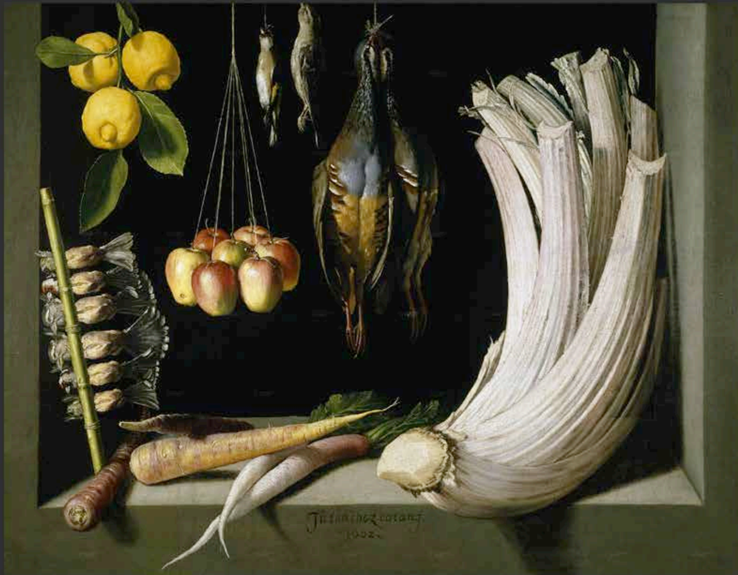
« Bodegón de caza, hortalizas y frutas » JUAN SÁNCHEZ COTÁN (1602)

Huile/toile, 69 x 89 cm. Madrid: Museo del Prado