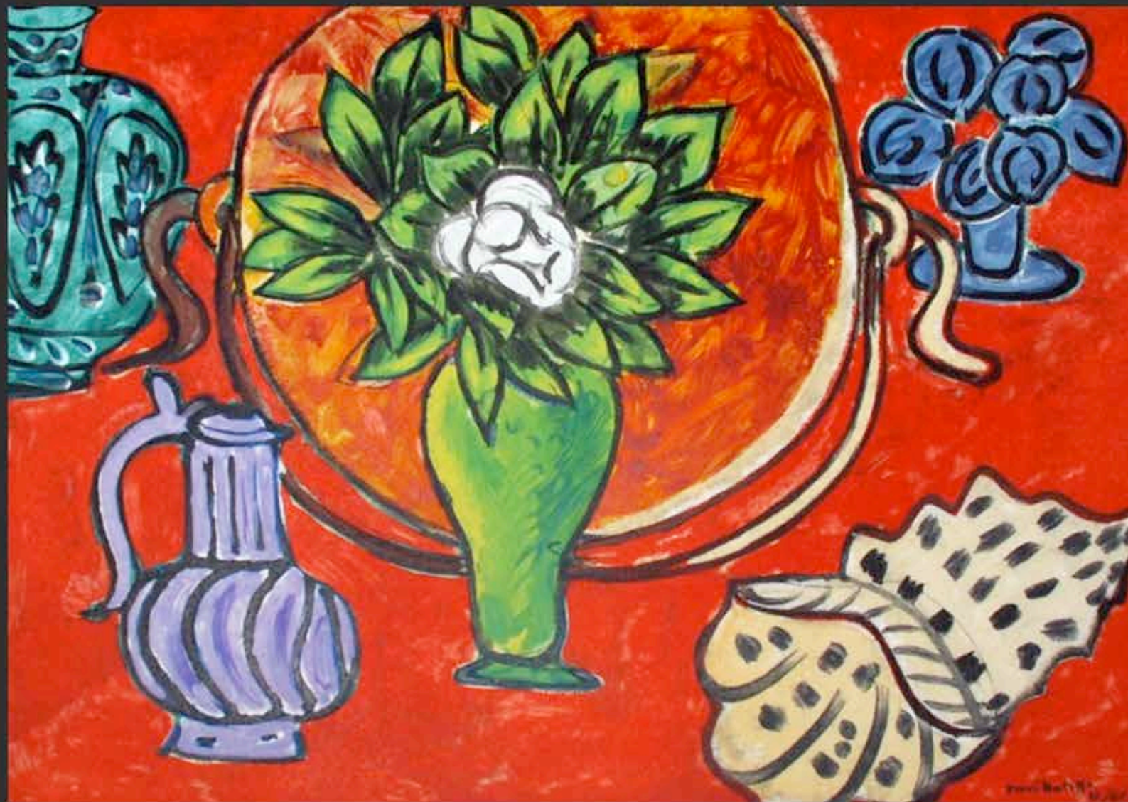
« Nature morte aux magnolias » HENRI MATISSE (1941)

Huile/toile, 74 x 101 cm. Paris: Centre Georges Pompidou