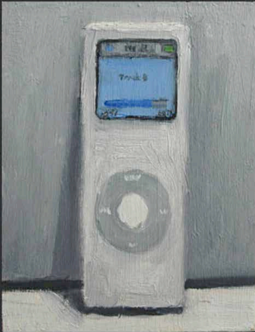
« Vanitas » JANET FISH (2012)