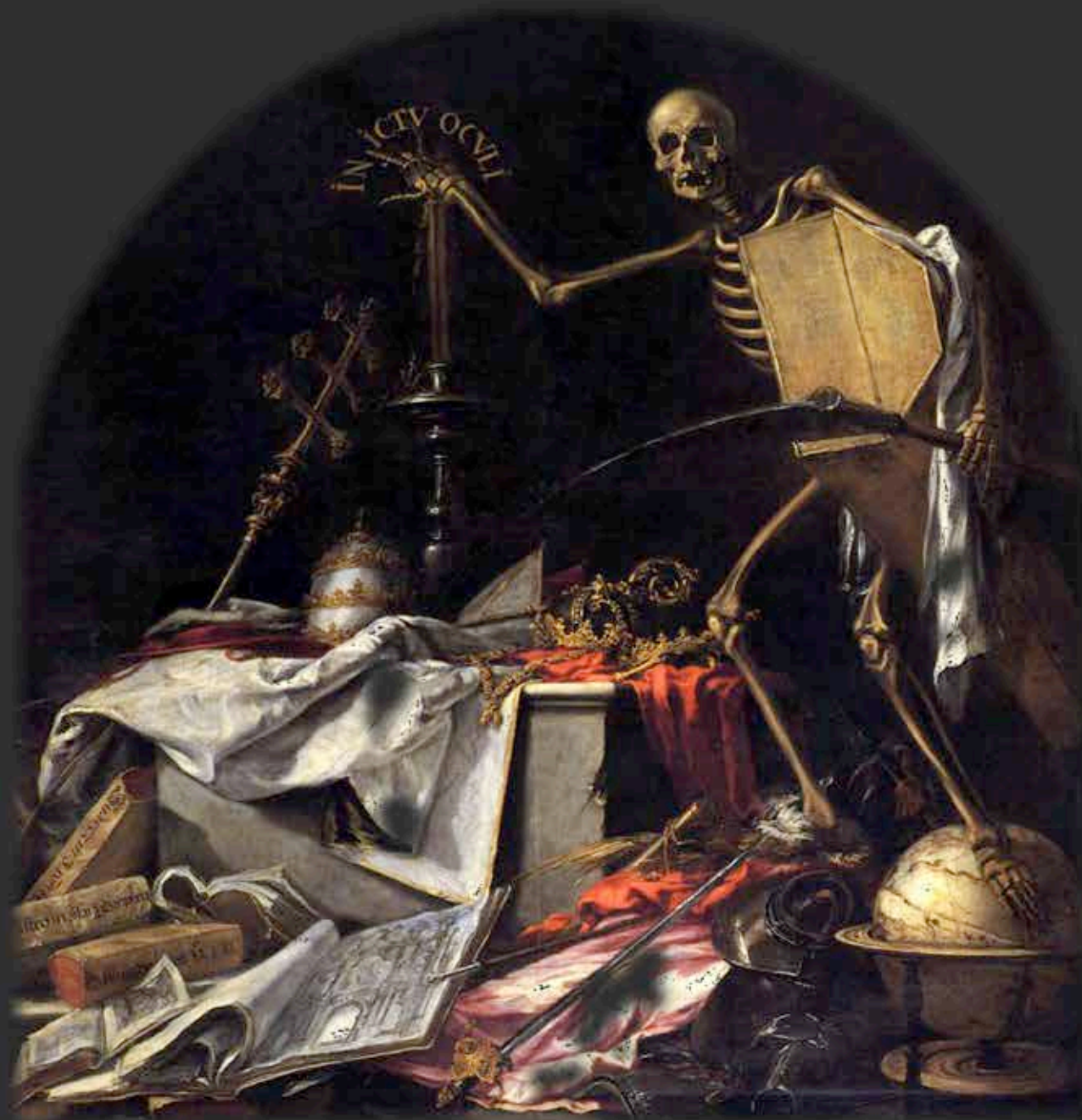
« In ictu oculi » JUAN DE VALDÉS LEAL (c. 1671)

Huile/toile, 220 x 216 cm. Sevilla: Hospital de la Caridad