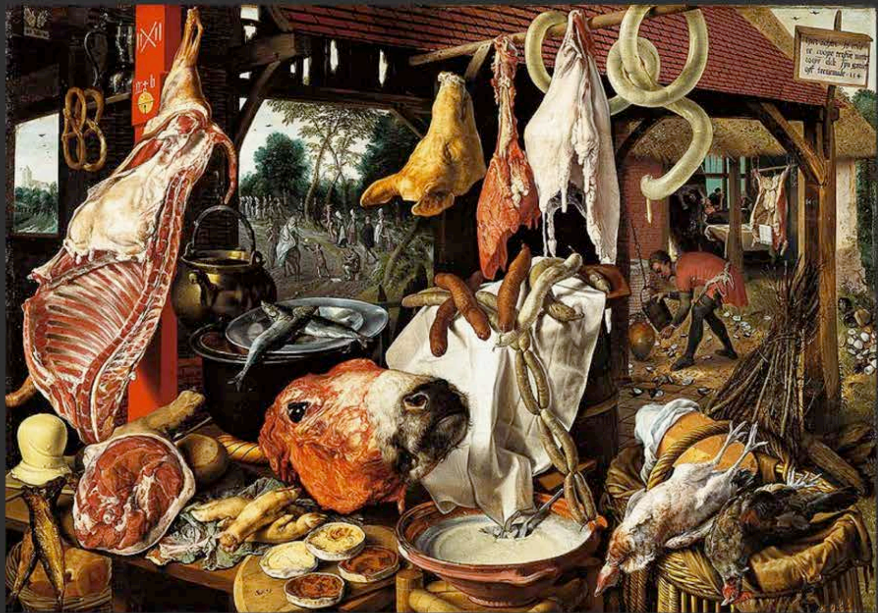
« L'Étal de Boucher » · PIETER AERSTEN (1551)

Huile/b., 115,5 x 168,9 cm. Raleigh: North Carolina Museum of Art