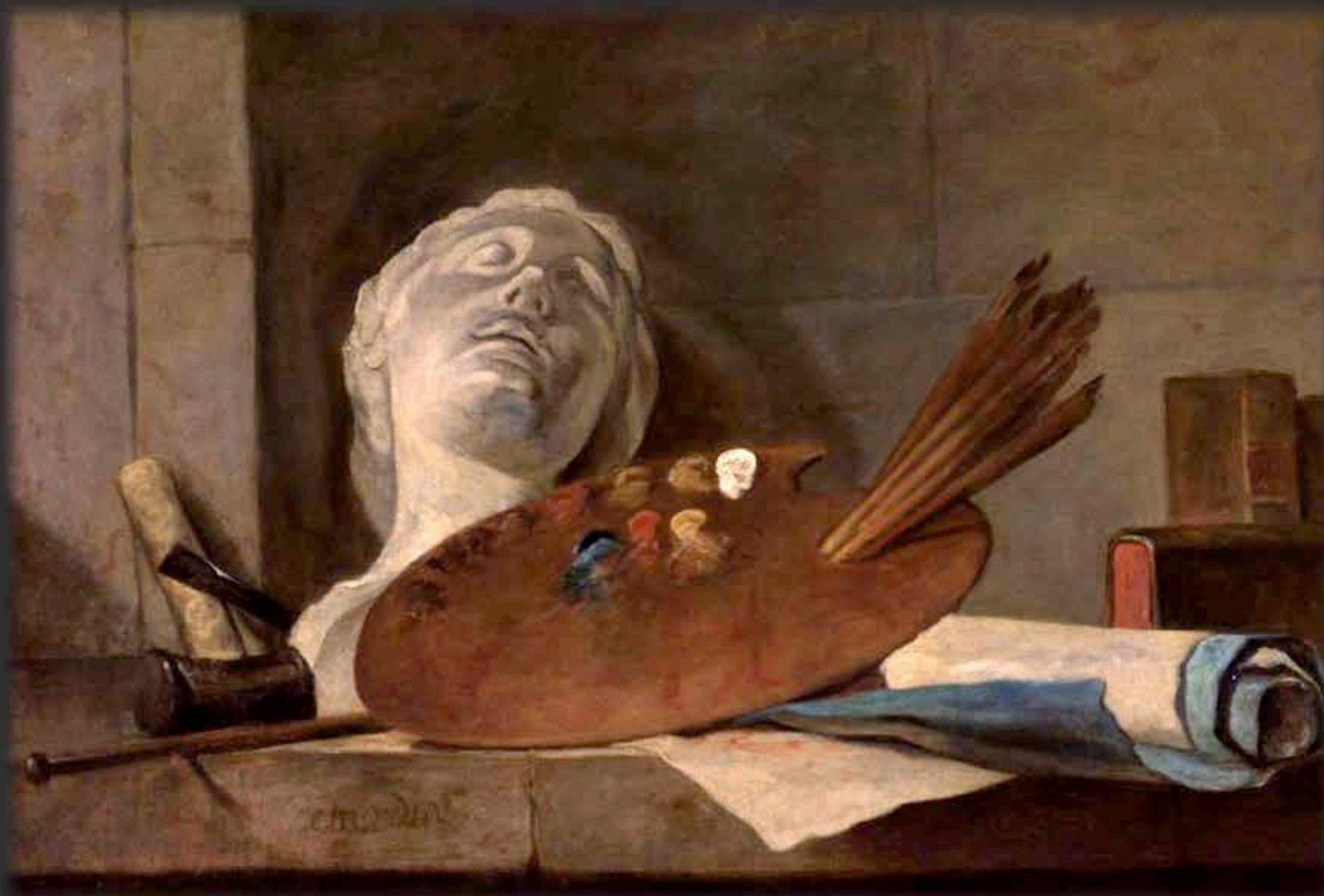
« Les attributs de la peinture et la sculpture » JEAN-BAPTISTE SIMÉON CHARDIN (c. 1728)

Huile/toile, 64 x 92 cm. Collection privée